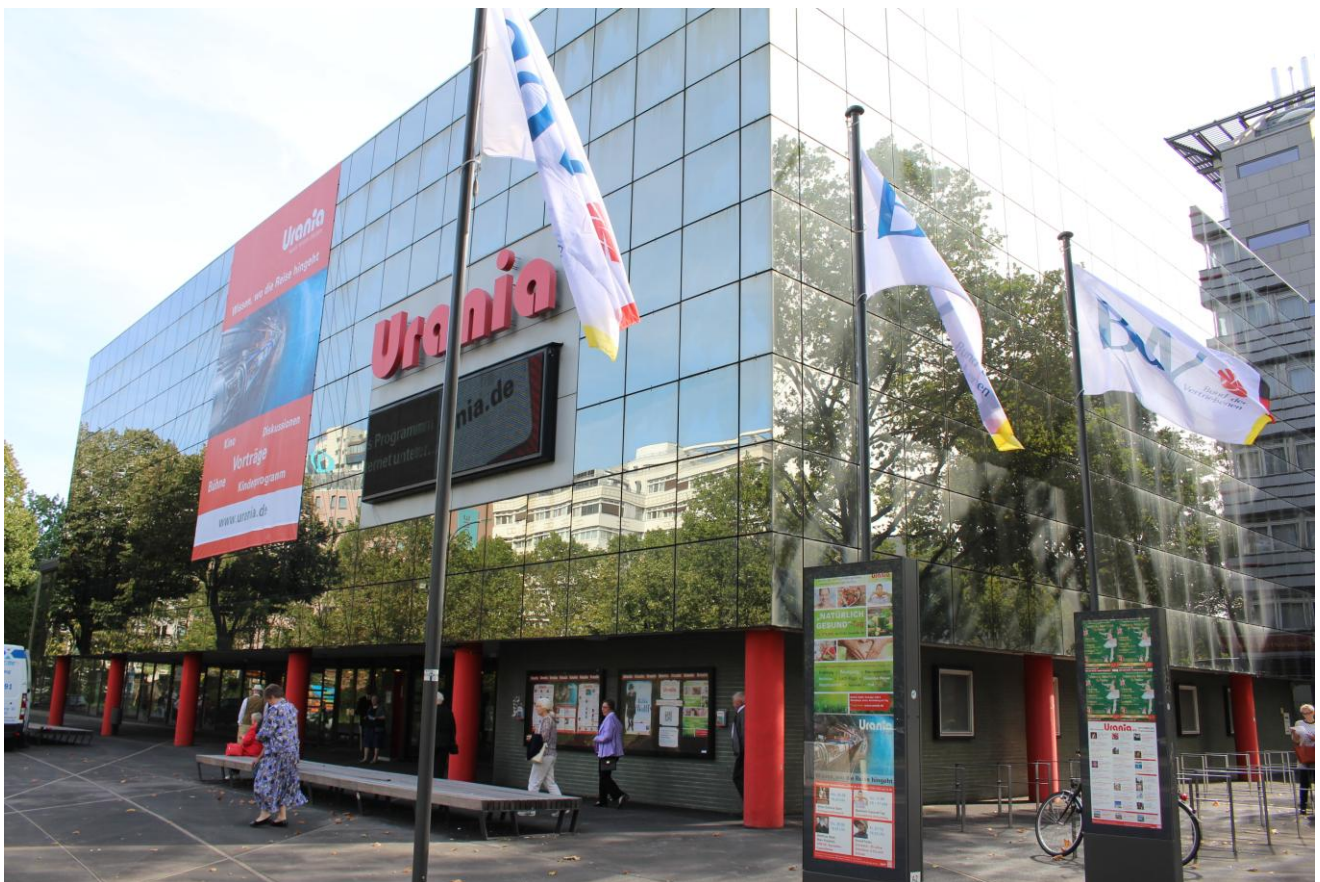
Die URANIA Berlin – Ort der Veranstaltung