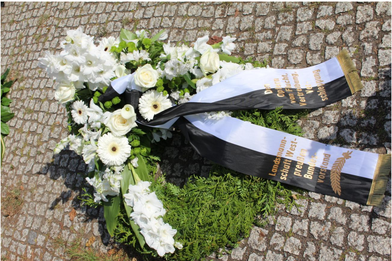
Der Kranz der Landsmannschaft Westpreußen e.V. (Bundesvorstand): Den Opfern von Flucht, Vertreibung, Verschleppung.