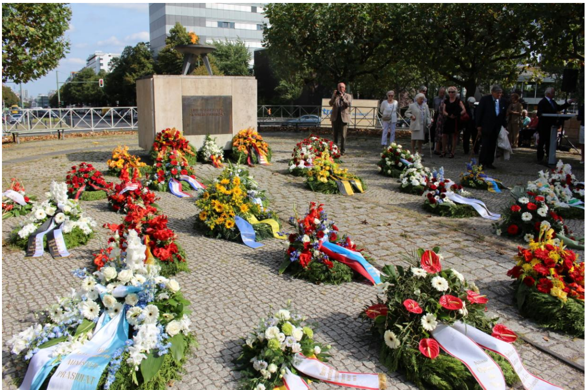
Das Vertriebenenendenkmal mit der ewigen Flamme.