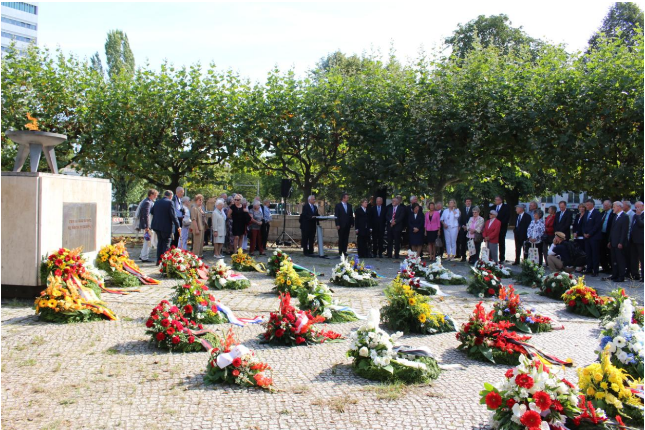
Blick zum Rednerpult